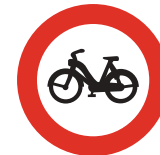
Entrada prohibida a ciclomotores