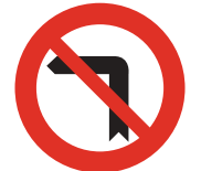
Giro a la izquierda prohibido (también el cambio de sentido)