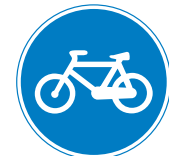
Vía reservada para ciclos o vía ciclista